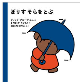
「ぼりすそらをとぶ」 翻訳 まつおか きょうこ ・なかの ゆりこ 880円 傘をさしてお出かけ。すると突風が!