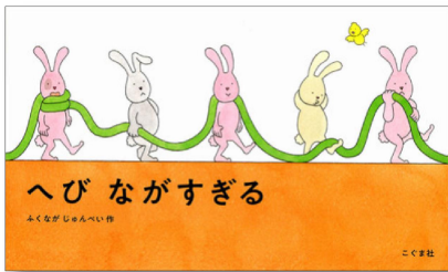
「へびながすぎる」 ふくなが じゅんぺい 作 こぐま社 1,540円

なわとび、すべりたい、ぶらんこ…動物たちが遊んでいる長〜いひも、まさかこれがヘビだとは誰も気づいていません。そして、まさかこの地面が〇〇だとは!