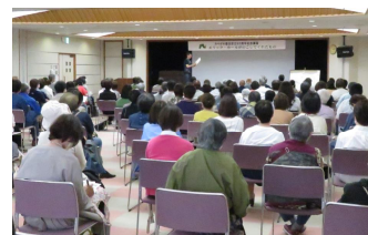
笑いと驚き、納得と共感の2時間19分