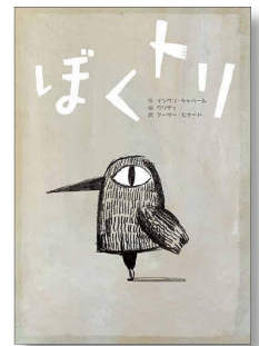
「ぼくトリ」 作 イングリ・シャベール 絵 グリディ 訳 アーサー・ビナード 千倉書房 1,650円

指揮者のヤングさん、「どうして指揮者になったのか」と記憶をたどっていくと…「どんなに自分がひとりで頑張っていると思っても、本当はひとりの力ではないのです」(あとがきより)