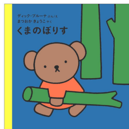
「くまのぼりす」 翻訳 まつおか きょうこ 880円 くまの「ぼりす」はとっても働き者。