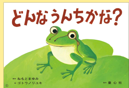
「どんなうんちかな？」 脚本 ねもとまゆみ 絵 ゴトウノリユキ 童心社 2,090円 12場面

「うんちをするのは いきてるしょうこ」。身近な生き物の生態がわかる紙芝居。外で見つけてみよう!