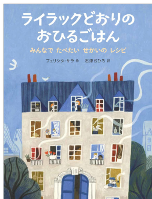
「ライラックどおりのおひるごはん」 フェリシタ・サラ 作 石津ちひろ 訳 BL出版 1,760円

ライラックどおり10ばんちのアパート。各部屋で作られるお料理は住人自慢のお国料理。レシピもちゃんと教えてくれます。描かれたキッチンも気になります。食器、スパイス、植物…異国情緒漂う画面。先日の講演会でアーサー・ビナードさんが「台所は人の生活、お国柄が出るおもしろいところ」とおっしゃっていました。なるほど！さてお料理ができあがったら庭に持ち寄って、楽しく美味しく異文化交流です。 (さつき)